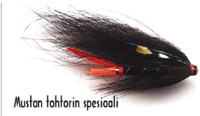
Mustan tohtorin spesiaali

Kalastus Mörrumjoella alkoi jo 1200-luvulla, mutta nykyinen organisoitu kalastus lähti käyntiin vasta keväällä 1941. Tänä päivänä Mörrumjoen kalastus on tunnettu ympäri maailmaa ja omalta osaltaan tunnettuutta tuo Mörrumista 8 kilometriä pohjoiseen Svängstassa sijaitseva ABU Garcia Ab:n tehdas, jonka vieraina on vuosien kuluessa nähty useiden valtioiden päämiehiä. Mörrumin koko kalastusalue on jaettu 32 pooliin. Eteläalue (poolit 1–16) ja pohjoisalue (poolit 17–32).