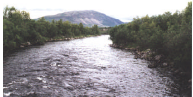
Lakselv - Pooli 3, yläosa, Riippusillan kohta.

Riippusillan kohtaan on Skogavarren mökkikylästä tasan 15 kilometriä Lakselvin kaupunkiin päin. Yläosaltaan lohenkalastus alkaa tästä.