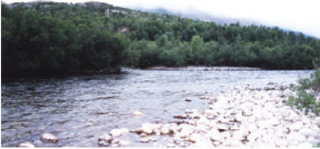
Lakselv - Pooli 3, alaosa.

Svingin mutkan vasemman reunan syväne on tavoitettavissa hyvin lohivavalla. Todella upea ja monipuolinen kalastuspooli.