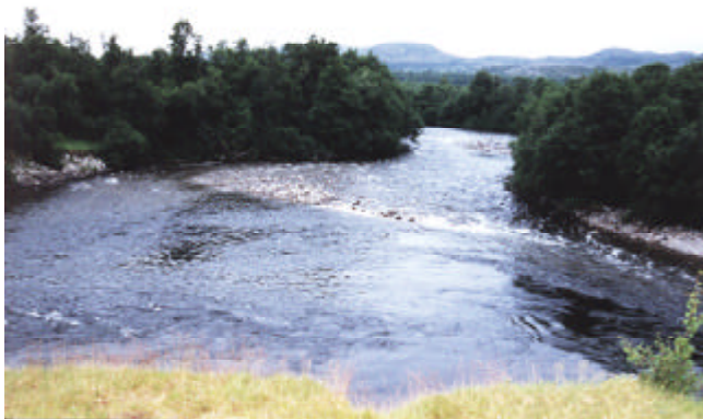
Lakselv - Pooli 3, Patokuoppa. Svinginsistä ylävirtaan.

Lomamme ajalle sattui Porsangerin kunnan Lakselvin iloiset lohiväivät (Glad Lakselv), joiden aikana sai lohilupaa 100 NOK/vrk, muuten lupa maksoi 350 NOK/vrk, lisäksi valtion lupa (180 NOK/vuosi) ja todistus kalastusvälineiden desinfiointista. Normaali luvalla saa kalastaa vain yhdellä poolilla, sillä jolle sen oli ostanut. Pooleja alueella on viisi ja niistä turistit saavat kalastaa ykköstä, kakkosta ja kolmosta sekä viitosta. Pooli 5 on uusi ja sieltä saatu lohi on vapautettava ja pooli 4 sijaitsee Porsangermoen so-tilasalueella, jolle pysähtyminenkin on kielletty. Kalastus on luvallista perhovehkeillä sekä koneongella. Lohiväivien luvalla sai lohituristi kalastaa kaikilla neljällä (1–3, 5) poolilla ja paikalliset tietenkin myös nelospoolilla. Kilpailun voittaja oli Per Iver Utsi Karasjoelta kolmella kalalla: 12,3 + 9,9 + 5,1 kg.