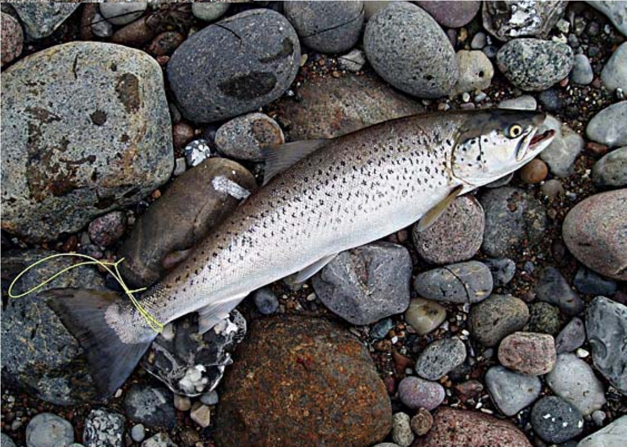
Matkan suurin taimen