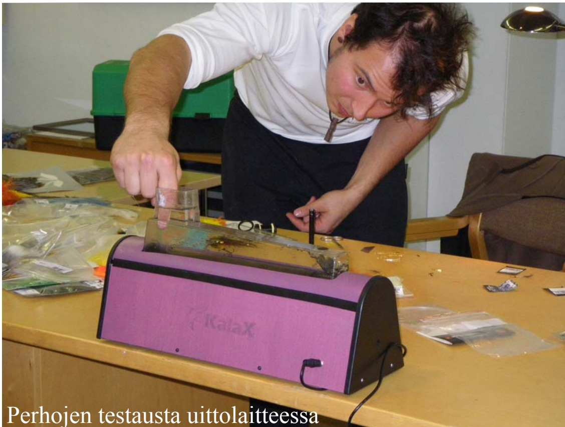
Perhojen testausta uittolaitteessa

Perhojen sidonnan välissä testattiin uittolaitteessa sidottujen perhojen uintia ja mielenkiinnolla seurattiin myös turbolevyjen vaikutusta perhon hahmoon ja uintiin. Turbolevy muodostaa turbulentsin virtauksen taakseen levittäen häkälää ja siipeä antaen perholle muhkeamman hahmon uudessaan. Turbolätkällä todettiin oleva jossain määrin merkitystä perhon silhuettiin.