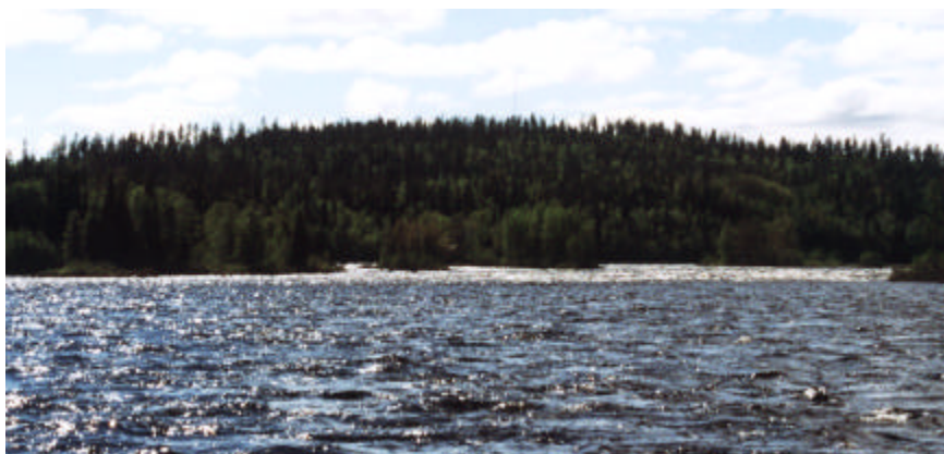
Tornion- ja Muonionjoen risteys. Edessä Ylisen-Lappeen kosken alaosa.

Lohensoutajien määrä oli melko vähissä Tornionjoella 90-luvulla, sillä saihan joella vielä 1994 kalastaa perämöötörin avulla. Vuoden 1996 merikalastusrajoituksen ansiosta nouseva lohi pääsi jokeen ja kutupaikoilleen. Vuosi 1997 olikin siten melkoisen hyvä lohivuosi. Lappeen kohdalla kalamiehet näkivät jopa satojen lohien lauttoja uivan ylävirtaan. Näin ollen kiire vain lisääntyi Lappeen lomakeskuksessa. Paras esimerkki tästä heikistä ajasta oli tapaus, jossa kaveri soitti Helsingistä ja varasi majoitusta, koska Väylältä oli juuri saatu 15 kg kirkaslohi. Sanoin varaajalle ettei kalaa ole saatu. Soittaja ilmoitti, että hänen ystävänsä oli soittanut just kännykällä ja soitatellut rullan jarrua