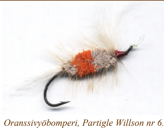
Oranssivyöbomperi, Partigle Willson nr 6.

Aina kun olin Väylällä palkattuna soutajana kalastin asiakkaalle, enkä kokenut kalastusta vapaaajaksi. No, ehkäpä tämäkin asia on luonteesta kiinni. Joka tapauksessa aikaa ei kuitenkaan löytynyt tarpeeksi omalle lohestukselle.