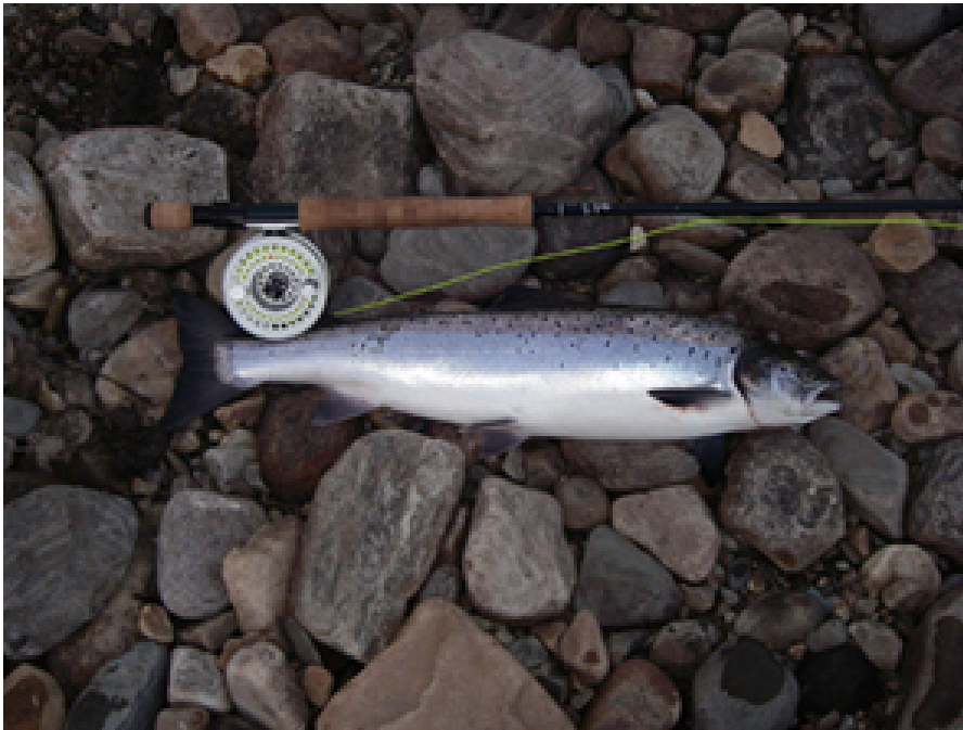
Kaksi hopeista vierekkäin, Hardy ja lohi. Pullukoita oli paratiisissa lohet. Kaikki meidän saamat lohet olivat koiraita.

kassa, se oli vuonna 1997, Tornio-Muonionjoella, Lappeenlomassa. Nyt tilanne toistui. Olimme perhokalastajan paratiisissa. Kaksi vuorokautta meni tosi nopeasti, ylhäällä oli neljä lohta, joista söimme kaksi. Retken alussa olleet mietteet, toisella Norjan purolla käyntiin, hävisivät yhteisellä päätöksellä. Päiväreppu tyhjänä, minulla kaksi lohta kantamuksissa pakastimeen vietäväksi, lähdimme vaeltaamaan paikalliselle kaupalle, uusien kalastuslupien oston. No matkaa olisi vain tuo vaatimaton viisi kilometriä. Suht´ tyhjällä repulla matka joutui nopsaan. Ostettiin uudet kahden vuorokauden luvat ja takaisin leiriin saavuttiin olutlastissa mukavasti.