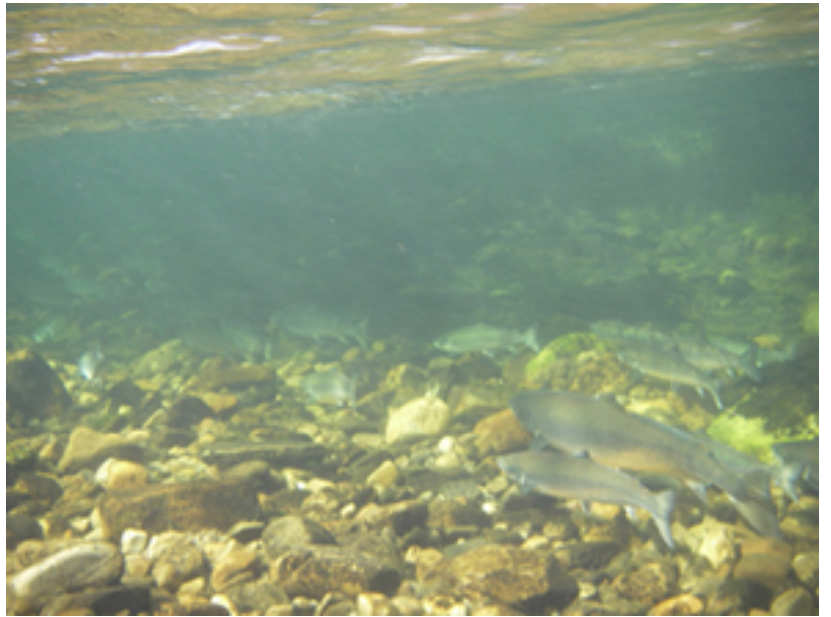
Tämän kuvan oton jälkeen, ei mennyt kuin hetki, kun perhovehkeet oli kasattu. Kuva on otettu nilkkavedestä eli lohet on noin metrin päässä kuvaajasta.

Lopulta, meikäläinen aivan lopussa, päästiin leiripaikalle, kello oli noin 22.00. Rinkkani putosi maahan ja lupasin, että en nosta sitä enää ikänä harteille. Leiri pantiin pystyyn ja alettiin katsella tilannetta. Joki oli tosi pieni, noin 15 metriä leveä, matala puro, jossa oli monttu leirin edessä. Olisiko täällä muka nousulohta? Digi-Pentax vireeseen ja vettenalaiseen valokuvaukseen.