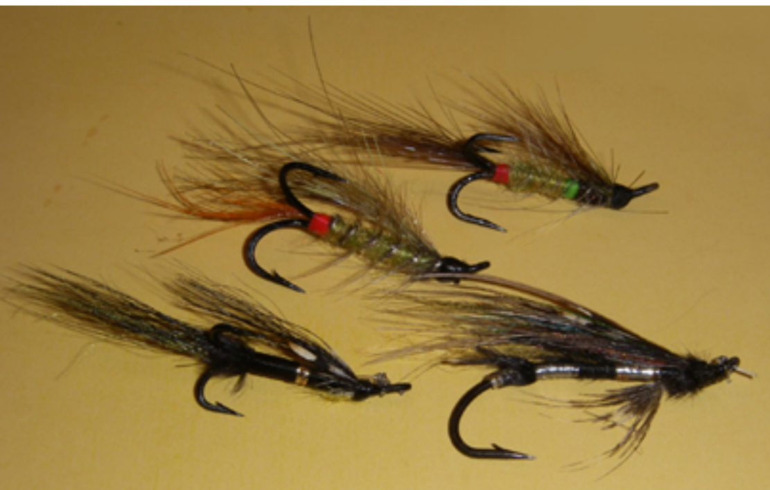
Ylin perho oli aamulla tappava, koko 8, seuraava alapäin päivä Jaakko, koko 6, Mar Lodge jäljitelmä (vuodelta -95) oli iltaperho, mustarunkoisessa Jaakko-kehitemässä oli yöllä useita lohia kiinni, ylös yksi. Perhon koko 10, oli liian pieni.