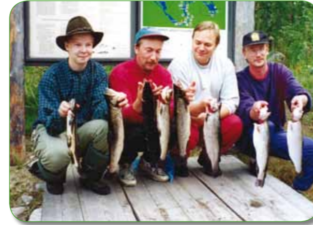
Kisasaalista Ruunaalta, 1995