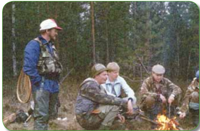
Seuran miehiä Peurajärvellä, 1988