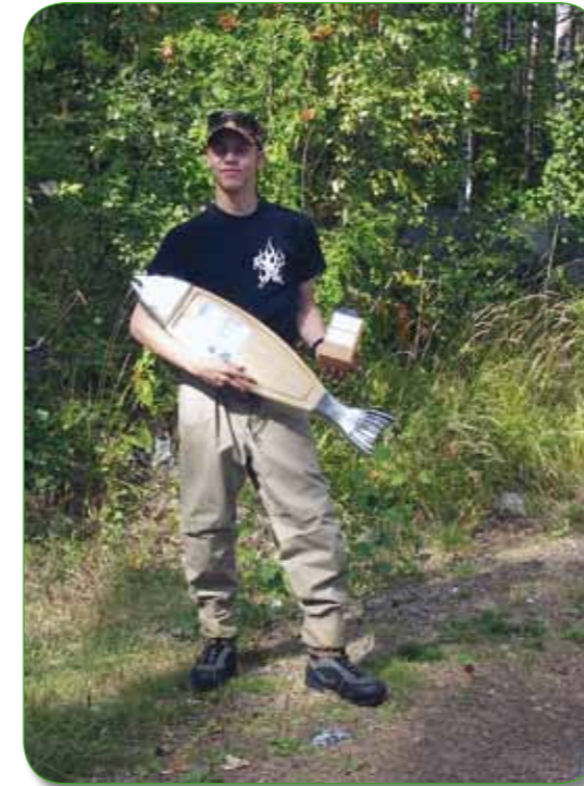
Kisavoittaja, Ruunaa 2006