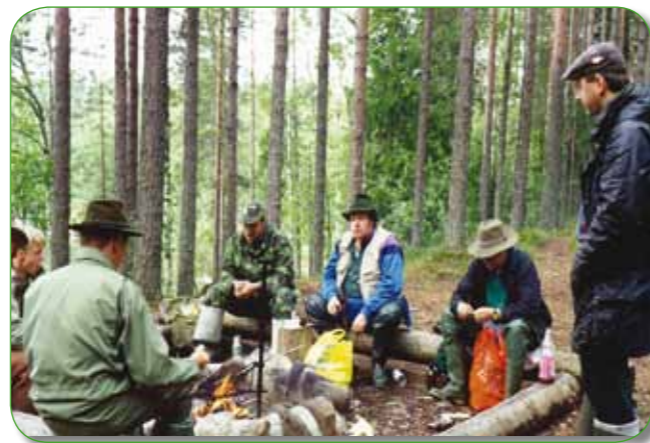
Seuran perhokalastuskisat Ruunaalla, 1995