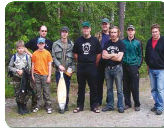
Kisaporukkaa Ruunaalta, 2007