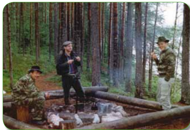
Seuran perhokalastuskisat Ruunaalla, 1994