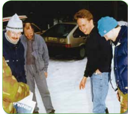
Seuran miehiä pilkillä 1989