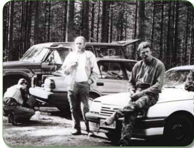
Seuran ensimmäiset perhokalastuskisat Ruunalla, 1990