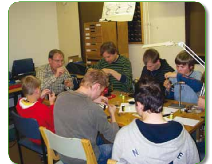
Blue Charm -perhon sidontaa