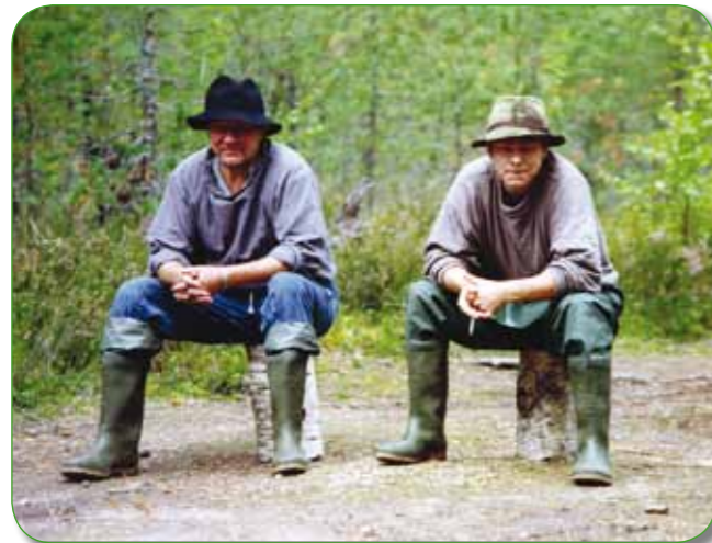
Seuran perhokalastuskisat Ruunaalla, 1992