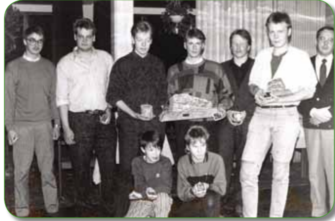
IV SM-kisat, 1986, Kajaani