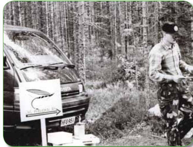
Ensimmäiset kisat, 1990